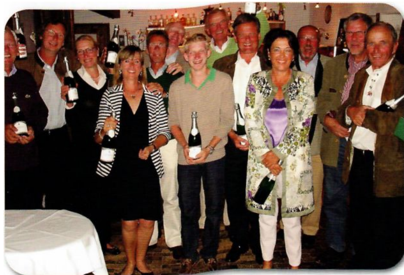
GEWINNER WAREN SIE ALLE